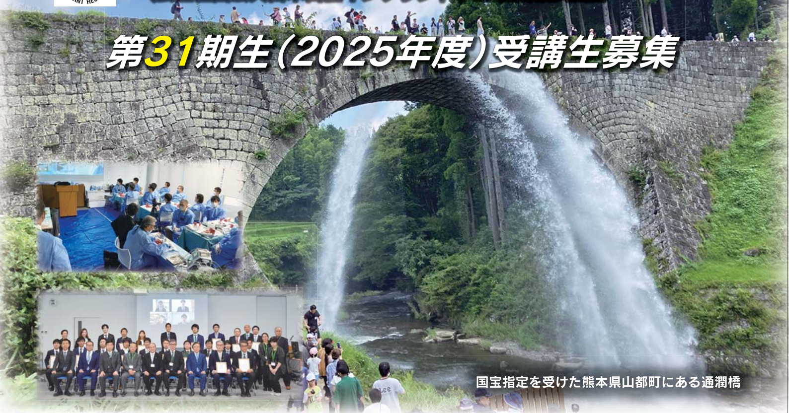
国宝指定を受けた熊本県山都町にある通潤橋